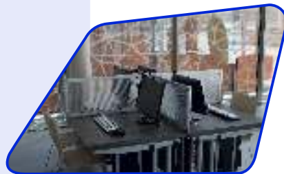
Îlots équipés et...